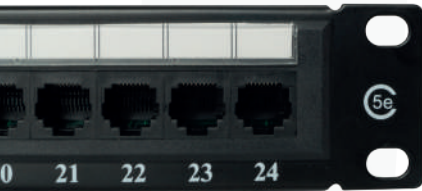
► Patch panel Cat. 5e.