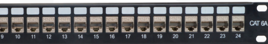
► Patch panel Cat. 6a Jacks desmontables tipo toolless con blindaje para atenuar distorsiones e interferencias. Organizador horizontal integrado con puesta a tierra.