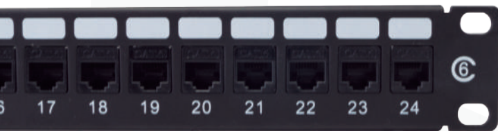
► Patch panel Cat. 6 Jacks desmontables para fácil administración e instalación. Organizador horizontal integrado