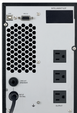
► POWEST WINNER 1 KVA