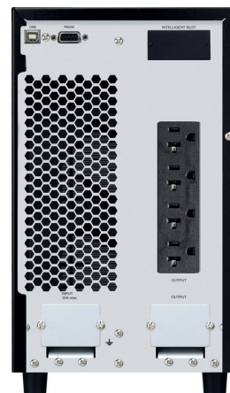
► POWEST WINNER 3 KVA