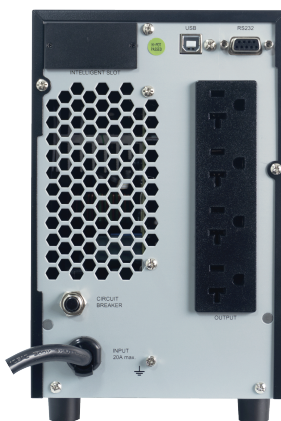
► POWEST WINNER 2 KVA